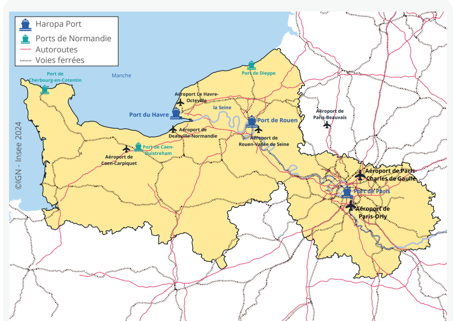
Source : Insee, IGN 2024.

Les établissements exerçant leur activité principale dans l'une de celles-ci appartiennent au secteur de la logistique (« logistique réalisée pour compte d'autrui »). Ces activités regroupent plus de 279 700 emplois dans la Vallée de la Seine. L'approche fonctionnelle regroupe 25 métiers du transport de marchandises, de l'entreposage et de la manutention. Elle permet d'identifier les métiers logistiques exercés dans le secteur de la logistique, mais aussi les métiers logistiques exercés dans des établissements non logistiques