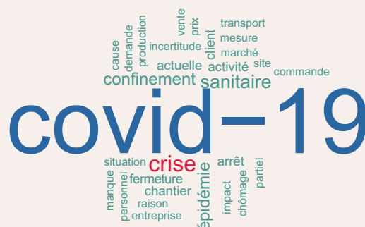
Figure 1 - Nuage des trente mots les plus cités par les entreprises

Lecture : plus la taille du mot est importante dans le nuage de mots, plus il apparaît fréquemment dans les commentaires laissés par les entreprises