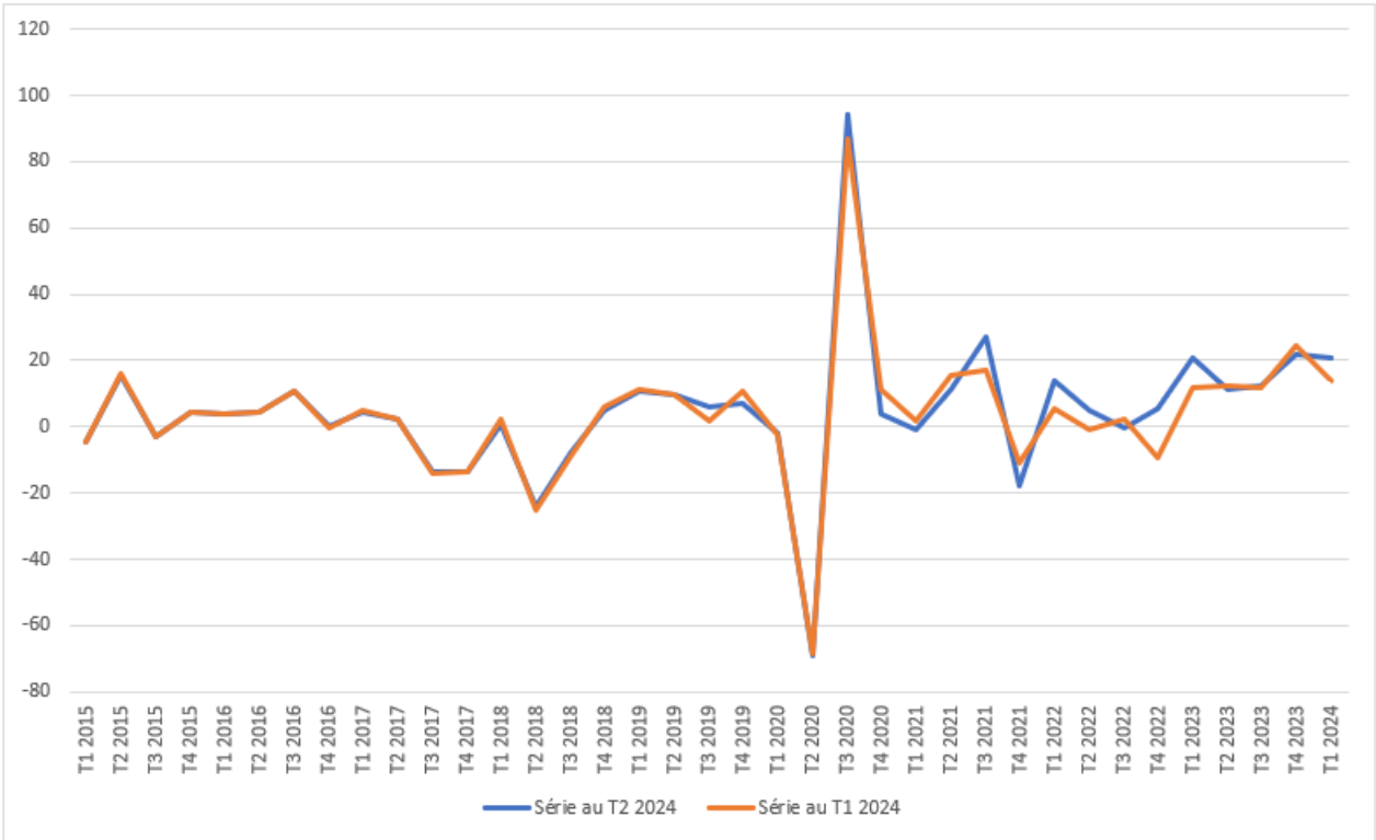
Figure 4. Evolution trimestrielle de l'emploi salarié public (en milliers)

Note : les données présentées ici sont celles diffusées le 30 août 2024, sans prise en compte d'éventuelles révisions a posteriori .