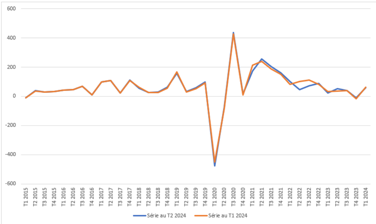
Figure 3. Evolution trimestrielle de l'emploi salarié privé (en milliers)

Note : les données présentées ici sont celles diffusées le 30 août 2024, sans prise en compte d'éventuelles révisions a posteriori . Source : Insee, Urssaf, Dares.